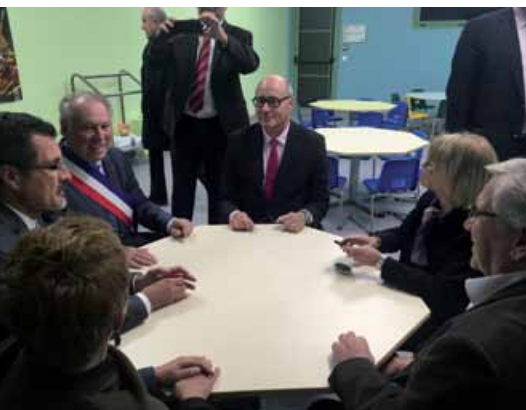
Monsieur le Sous-Préfet et les élus à la table des maternelles.

Un an exactement après la pose de la première pierre, le restaurant accueillait les enfants comme prévu le 4 septembre dernier, jour de la rentrée 2017.