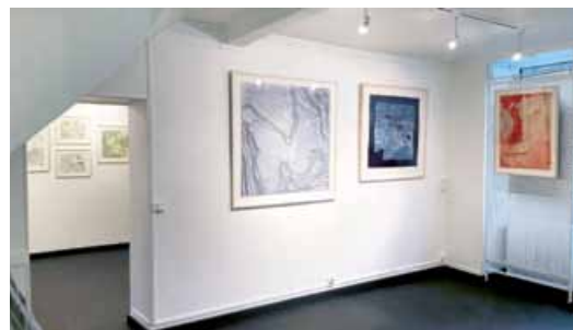
Galerie Caron Bedout