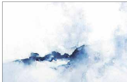
Tableau de Sylvie Duval exposée à la Petite Galerie