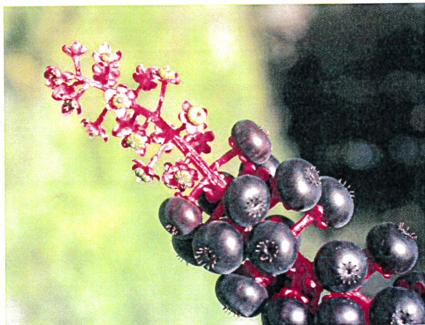
Fruits de la Phytolacca Americana