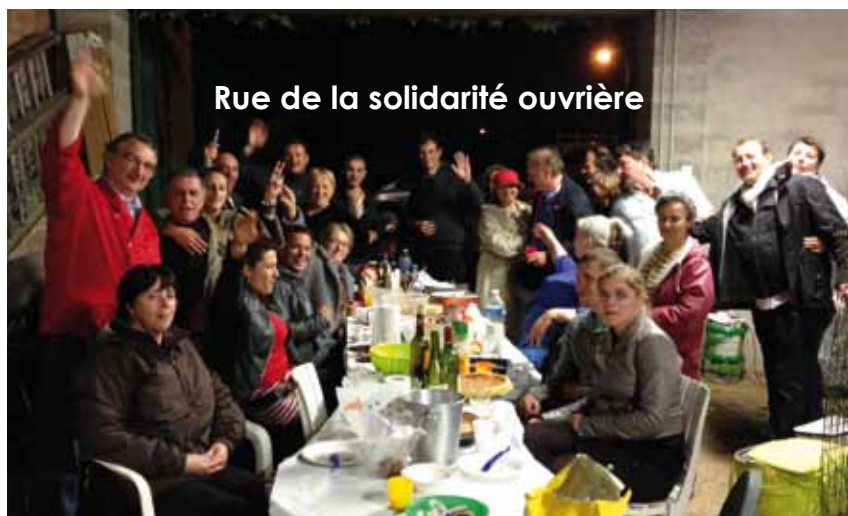
Rue de la solidarité ouvrière