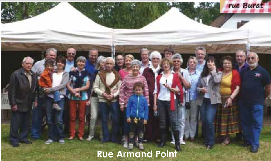
Rue Armand Point