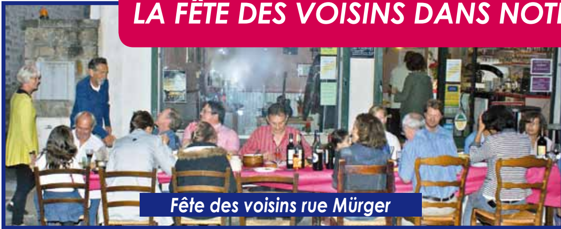
Fête des voisins rue Mürger