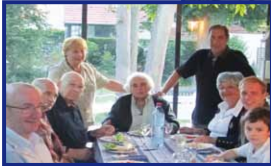
Fête des voisins rue des Grands Réages