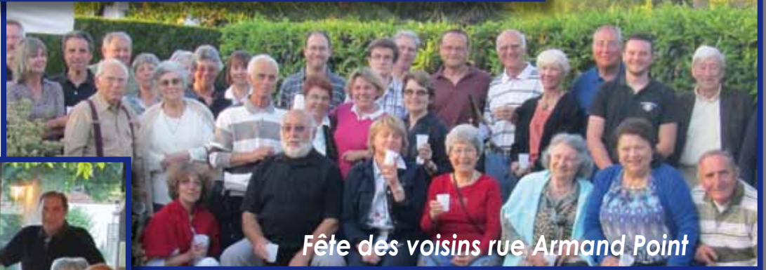
Fête des voisins rue Armand Point